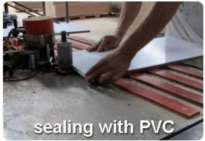
sealing with PVC