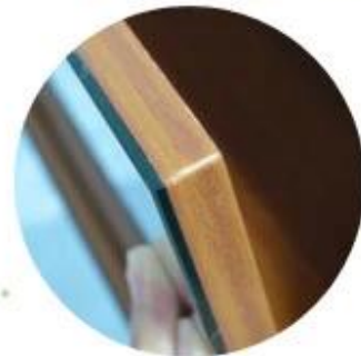
13mm MDF wood malemine glue with 3mm mirror