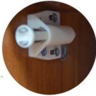
Inside with magnet lock