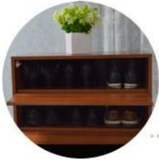
Each drawer max can hold 5 pairs lady shoes