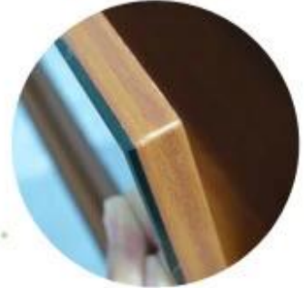
13mm MDF wood malemine glue with 3mm mirror