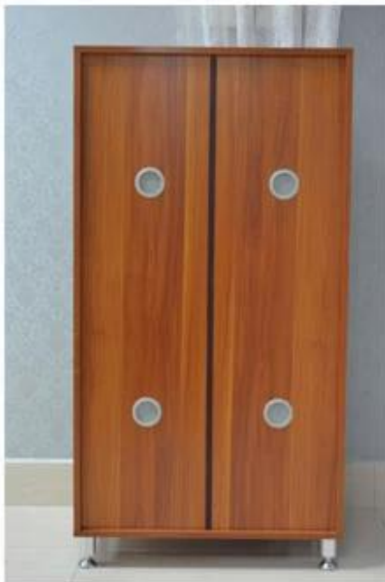
4 air holes on the back