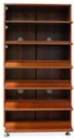
Drawers can be changed to 6,5,4,3,.....