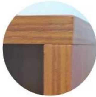
15mm MDF wood malemine