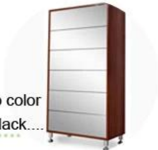
Mirror can be changed to color panel, such as red, pink, black....