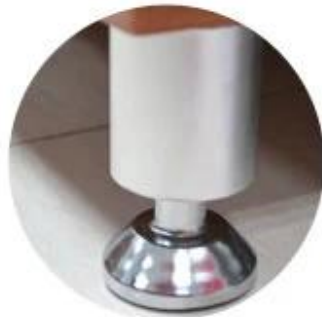
Bottom with 4 stand supporter

Product Name & nbsp; 衣柜 & nbsp; 木质衣柜 & nbsp; 木质衣柜 & nbsp; 木质 Product Code & nbsp; GLS18812 Material & nbsp; 木质, 木质 木质, & nbsp; 木质 & nbsp; 木质 & nbsp; 木质 & nbsp; 木质 & nbsp; 木质 & nbsp; 木质 MDF & nbsp; 木质 & nbsp; 木质 & nbsp; 木质 & nbsp; 木质 & nbsp; 木质 & nbsp; 木质 & nbsp; 木质 & nbsp; 木质 Hardware & nbsp; 木质 & nbsp; 木质 & nbsp; 木质 & nbsp; 木质 & nbsp; 木质 & nbsp; 木质 & nbsp; 木质 & nbsp; 木质 6 & nbsp; 木质 & nbsp; 木质 & nbsp; 木质 & nbsp; 木质 & nbsp; 木质 & nbsp; 木质 & nbsp; 木质 & nbsp; 木质 & nbsp; 木质 & nbsp; 木质 & nbsp; 木质 6 doors: Each door max can hold 5 pairs of lady shoes. H120 * & nbsp; W63 ** D34cm H60 * W18cm : & nbsp; 125 * 39 * 14cm B: & nbsp; 69 * 41.5 * 16cm : & nbsp; 49.2 " * 15.4 " * 5.5 " B: & nbsp; 27.2 " * 16.3 " * 6.3 " 2 & nbsp; 木质 & nbsp; 木质 & nbsp; 木质 & nbsp; 木质 & nbsp; 木质 & nbsp; 木质 & nbsp; 木质 & nbsp; 木质 & nbsp; 木质 & nbsp; 木质 & nbsp; 木质 & nbsp; 木质 A=A double wall strong master carton can pass international standard carton drop test. 0.114 (CBM) N.W. / G.W(KGS) 20GP 245PCS 40HQ 585PCS 41.5 / 46